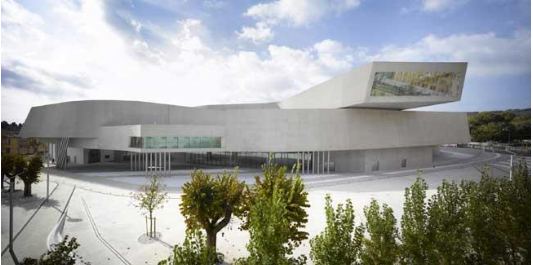
FOTO: Außenfassade Des MAXXI

Auf dieser Romreise haben wir uns sehr viele alte Bauten angesehen, dennoch war an einem Tag Zeit sich die moderne Architektur Roms anzuschauen. Bei dieser Gelegenheit haben wir das Nationalmuseum für Kunst und Architektur des 21. Jahrhunderts (MAXXI) besucht. Wir hatten besonderes Glück denn wir konnten uns dieses Kunstwerk von Zaha Hadid kostenlos auch von innen ansehen. Zaha Hadid ist eine irakianische Architektin, die für ihre futuristischen und dynamischen auf der ganzen Welt, bekannt ist.